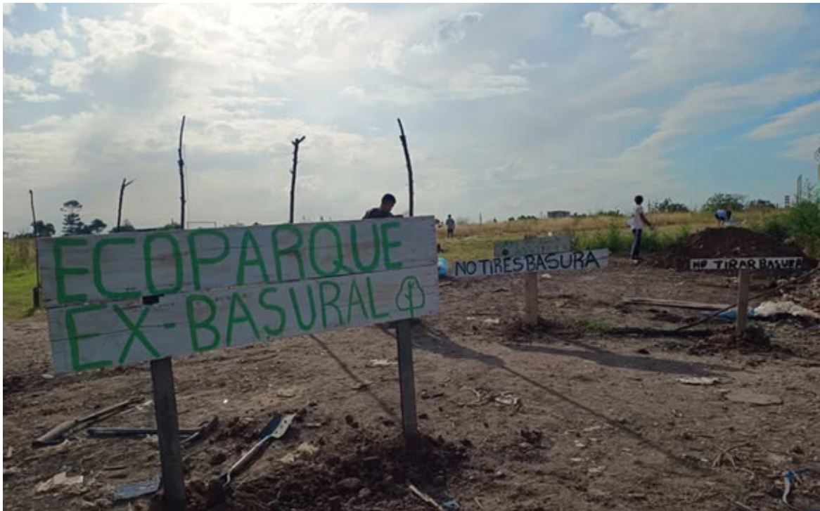
Imagen 1: Cartelería hecha por vecinos y vecinas de la Asociación Civil Ecoparque Nativo Manzanares.