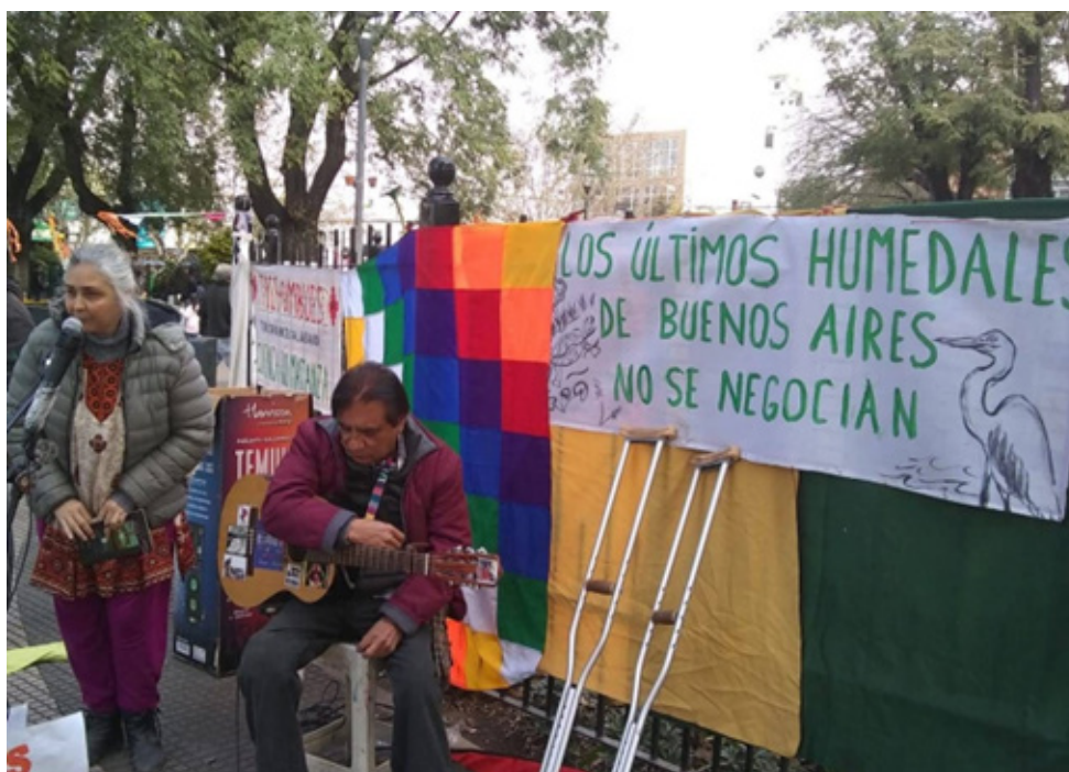
Imagen 3: Vecinos y vecinas de La Matanza realizando una manifestación en defensa de los humedales. Año 2019. San Justo, La Matanza.