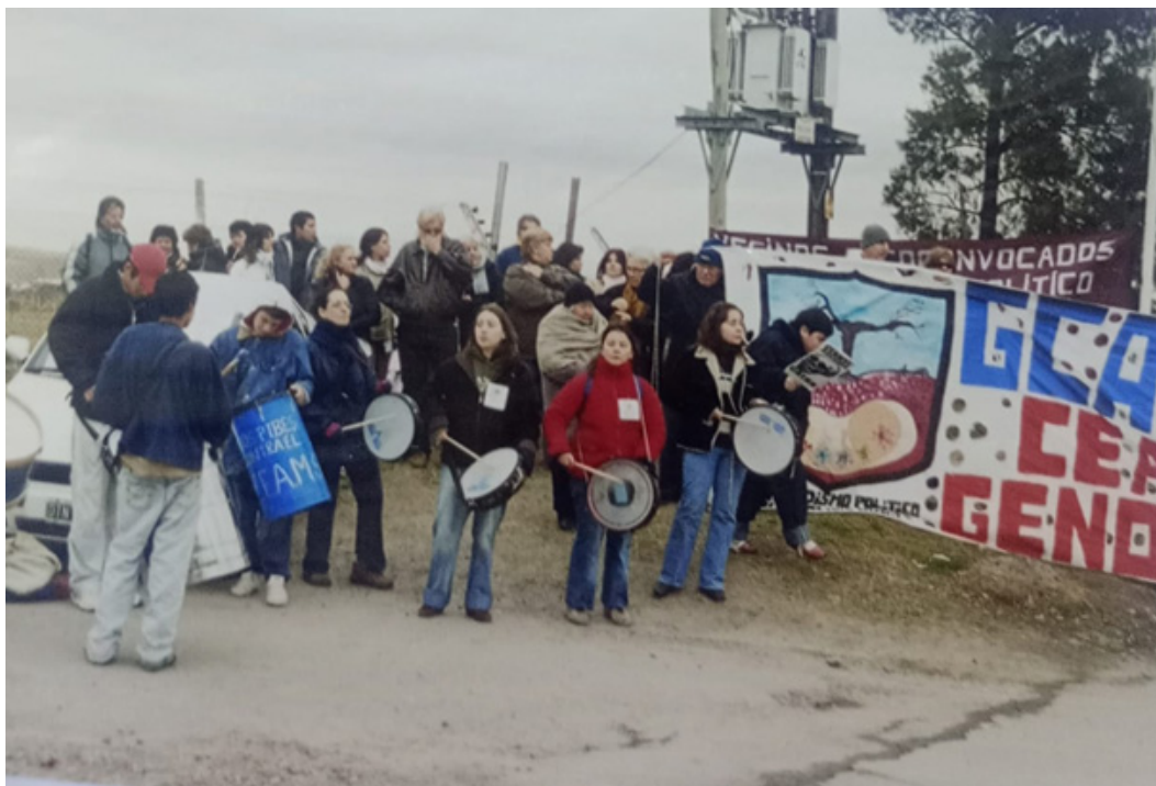
Imagen 2: Integrantes de la organización “Vecinos autoconvocados en contra de la contaminación ambiental del CEAMSE”, realizando una manifestación en las puertas del CEAMSE. Año 2002. González Catán. La Matanza.